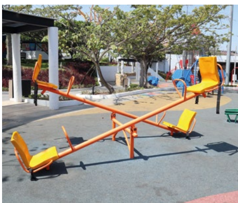
Sube y Baja con Asientos en Compuesto Plástico Reforzado: Sube y baja inclusivo asientos y cinturones de seguridad para personas con movilidad limitada.