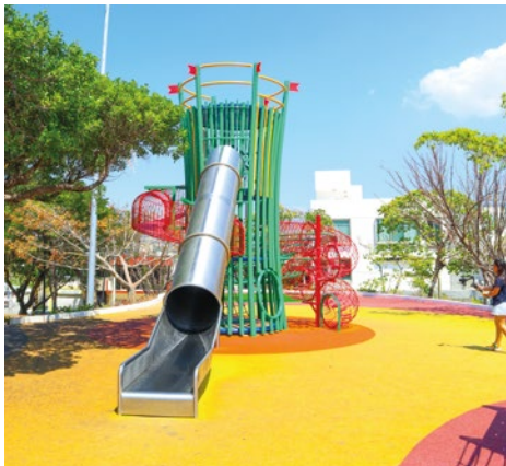
Módulo Atalaya: Mega estructura de más de 5 metros de altura y resabaladilla de acero inoxidable.