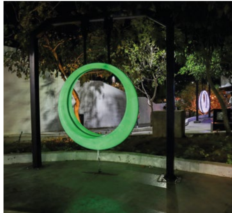
Columpio Lucendi: Mecedora con iluminación que al detectar movimiento las luces cambian de colores.