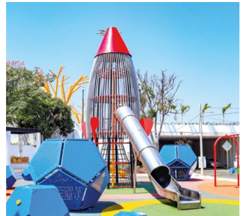
Módulo Nave Titán: Mega estructura temática de más de 8 metros de altura acompañada de 7 asteroides con diversas actividades.