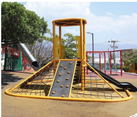
Trepadero Vitex: Trepadero piramidal de cuatro lados con dos paredes de escalar y dos resbaladillas.