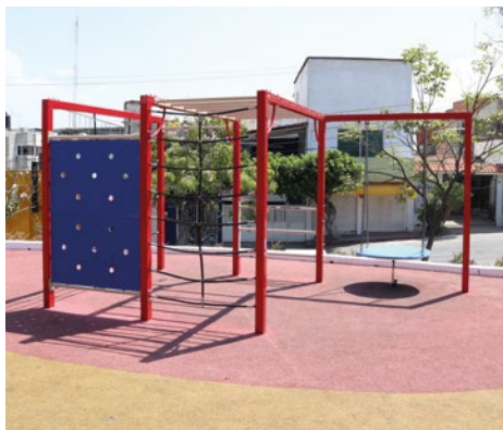
Trepadero Multiple: Trepadero con pared de escalar, cuerdas, aros, pasamamos y columpio de canasta.