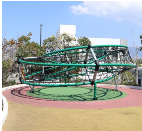
Epsilon: Escultura lúdica con 6 aros y 4 piezas curvas largas con una inclinación, cuerda con alma de acero y conectores de compuesto plástico reforzado.