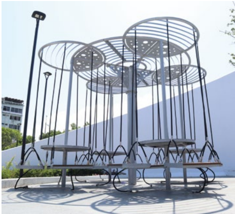
4 Mesas de picnic con asientos suspendidos con pérgola.