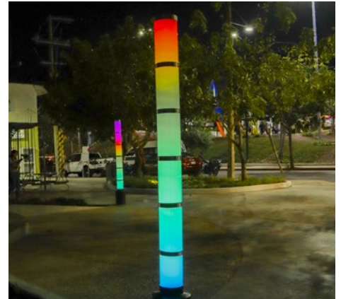
Light Pillars: Pilares iluminados con animación LED que incluyen 5 aros que al tocar cada uno genera un destello de luz de color diferente.