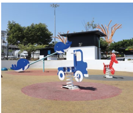
Montables: Diversidad de juegos montables individuales y sube y bajas temáticos para complementar el espacio.