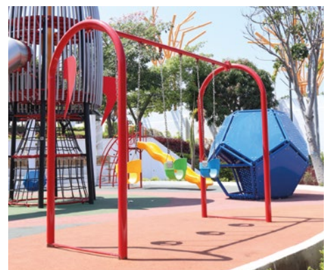
Columpio pp en u con 3 asientos de seguridad: Columpios con asientos de seguridad para el aprovechamiento de los más pequeños.