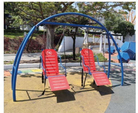
Columpio con camastro de plastipanel: Columpio inclusivo con camastro y cinturones de seguridad para personas con movilidad limitada.