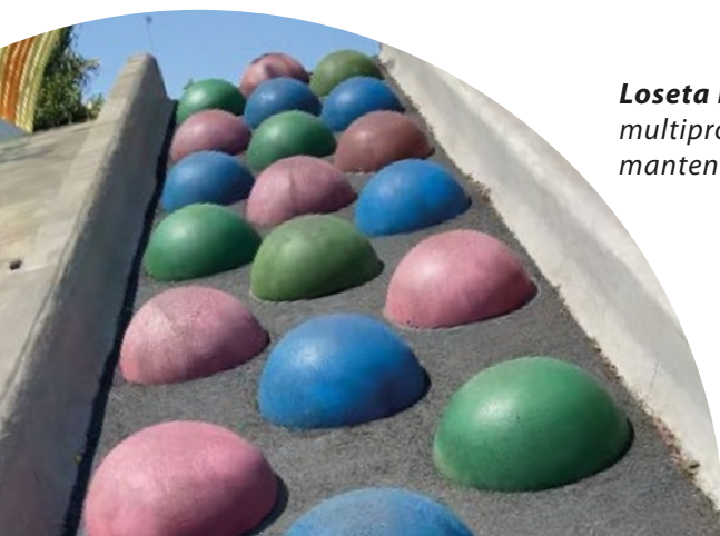
Loseta Burbuja de Caucho: Loseta de caucho multipropósito de fácil instalación y mantenimiento.